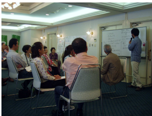
伝え方についての講演

推進員の全体研修会が、長崎 I・K ホテル（長崎市恵美須町）で5月26日（土）、27日（日）の2日間