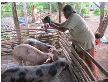
軌道に乗ってきた？豚飼育

ノリア孤児院の子どもたちに一昨年、揚水ポンプと貯水タンクを当法人から寄贈していましたが、源水の井戸水に塩分、シリカ分が多く、そのままでは飲めず、池の水を2度ろ過して飲料水として使っていました。その改善策として雨水をタンクにためて、ろ過し