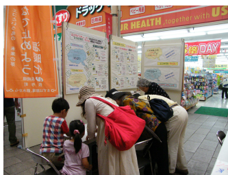
西彼地区推進員のブース

6月9日（土）、長崎市浜の町ベルナード観光通りで、長崎県と市が主催、浜んまち6商会協賛の街頭キャンペーンが、環境月間（6月）中の取り組みとして開催された。