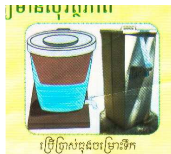
セラミックろ過装置

また、探していた最終ろ過装置も手ごろなセラミックろ過装置が見つかり、設置の段取りを済ませました。