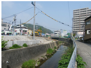
時津川 (時津公民館付近)

6月27日(水)、時津小学校の総合的な学習(4年生3クラス対象)に青山が参加した。時津川は長崎市横尾町鳥帽子岳や時津町鳴鼓岳に発し、山から団地、事業所などの排水、用水路、側溝、河川などの水と合流し“ごみや汚染水”を加え